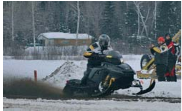
RESULTAT KAMOURASKA 2015